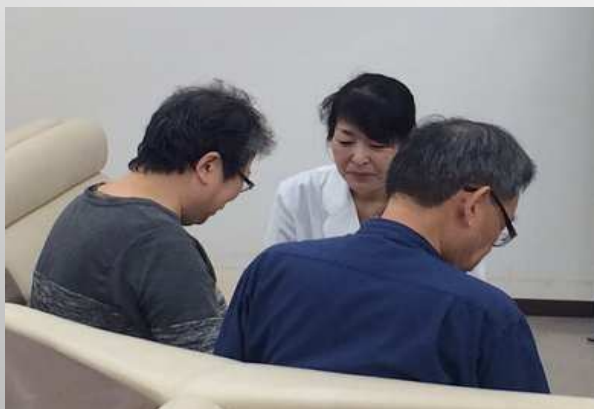
低GI食品についてもご紹介しました。

今回は糖尿病:低血糖の怖さをご理解いただき、予防と対処方法についてのセミナーを行いました。