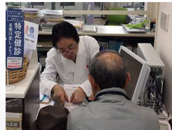
お薬相談も同時開催しました。